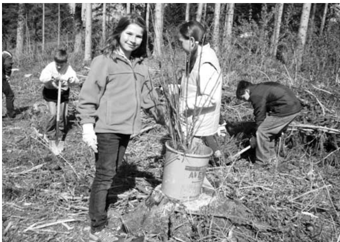
Wir Kinder sind der Meinung: »Das war spitze!«

Geschrieben von den Schülern der Klasse 4a