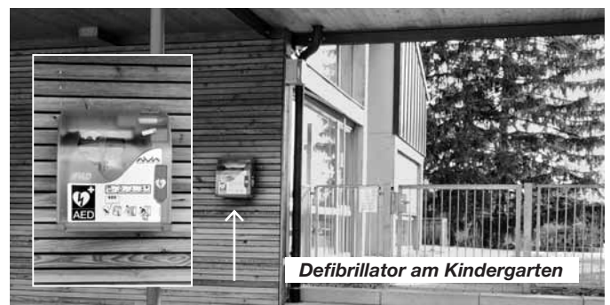
Defibrillator am Kindergarten

Der zweite Defibrillator ist in Lauben am Kindergarten befestigt. Er befindet sich im Eingangsbereich links neben dem Zugang zum Garten (unteres Foto).