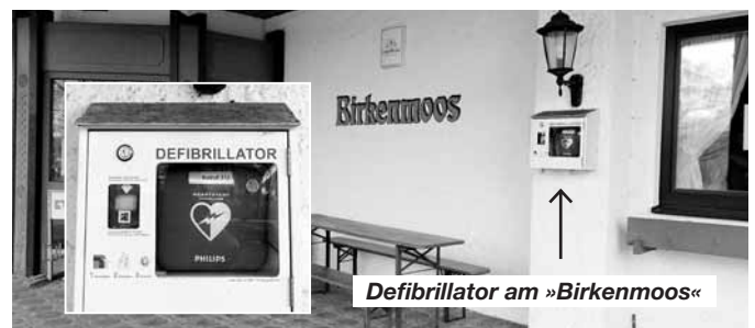
Defibrillator am »Birkenmoos«

Ein Defibrillator ist im Ortsteil Moos untergebracht. Dieser hängt am »Birkenmoos«, rechts neben dem Eingang (Bild rechts oben).