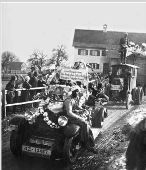
Das mit Geldscheinen dekorierte Auto