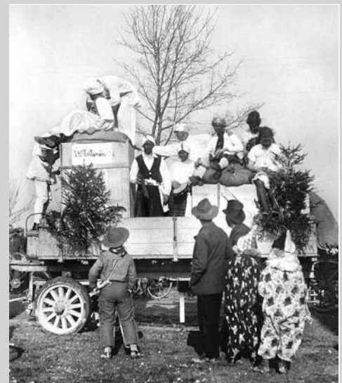
Die riesige Geldkiste mit indischer Begleitung

Schon im Jahre 1930 fand ein Fasnachtsumzug in der Dorfstraße von Heising statt. Das damalige Motto lautete: »Das indische Erbe«. Hintergrund waren wohl die prahlerischen Aussagen dreier Bürger aus der Umgebung, die immer wieder behaupteten, dass sie ein riesiges Erbe aus Indien erhalten würden.