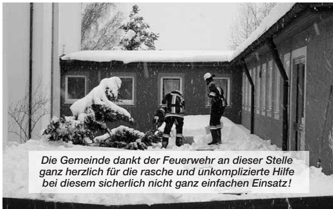
Die Gemeinde dankt der Feuerwehr an dieser Stelle ganz herzlich für die rasche und unkomplizierte Hilfe bei diesem sicherlich nicht ganz einfachen Einsatz!

Am Dienstag, 7. März, wurden wir um 16.00 Uhr zum Schneeräumen auf den Dächern der Schule und des Gemeinschaftshauses »Birkenmoos« gerufen. Durch den starken Schneefall der letzten Tage und das drohende Tauwetter mit Regenfällen wurde ein Statiker von der Gemeinde beauftragt, die Dächer der Gemeinde zu überprüfen. Dieser kam zu dem Entschluss, dass das Dach im Eingangsbereich der Turnhalle geräumt werden muss. Das Dach des Gemeinschaftshauses »Birkenmoos« wurde vorsorglich aufgrund des vom Wetterdienst angesagten Nassniederschlags geräumt. Wir alarmierten unsere Käfte um 16.30 Uhr und begannen mit Schaufeln und Schneehexen die Dächer zu räumen.