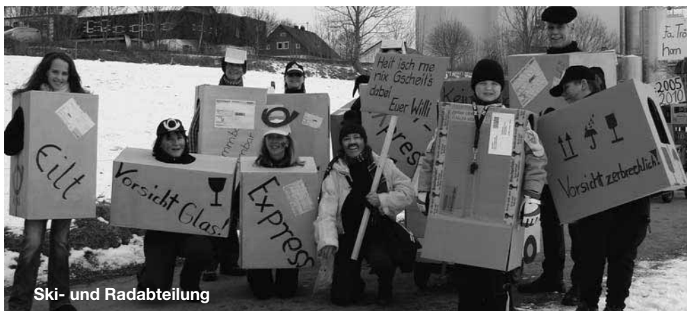
Ski- und Radabteilung