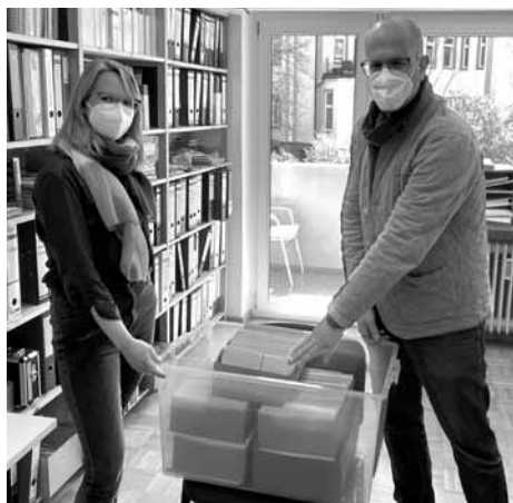
Übergabe Rückmeldungen der Bürgerbefragung